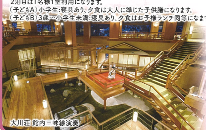
大川荘 館内三味線演奏

2泊目は1名様1室利用になります。 (子どもA)小学生:寝具あり、夕食は大人に準じた子供膳になります。 (子どもB)3歳~小学生未満:寝具あり、夕食はお子様ランチ同等になります。