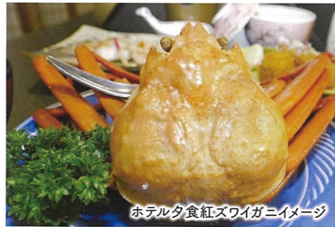
ホテル夕食紅ズワイガニイメージ