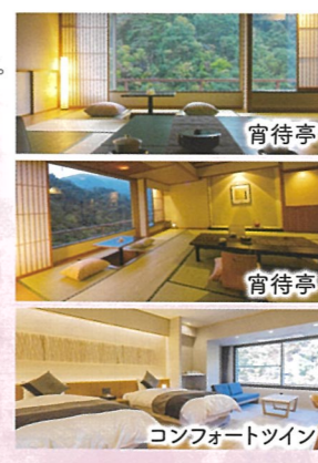
コンフォートツイン