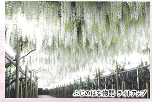
ふじのはな物語 ライトアップ